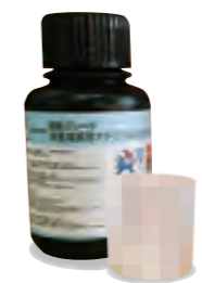
A液 特級グレード 次亜塩素酸ナトリウム6%