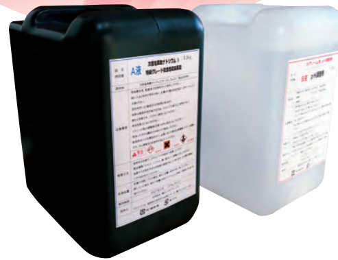
ジアノーム生成原料