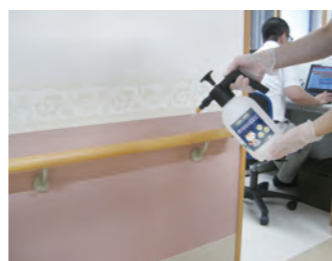
廊下の手すりにも