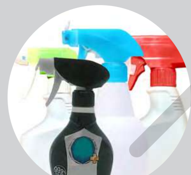
市販の除菌スプレー

日頃から感染症対策（食中毒やインフルエンザ・ノロウイルスなど）の充実を図るために、さまざまな方法を行っていますが、どれも多くの問題点を抱えています。これでは、しっかりとした除菌効果は期待できません。