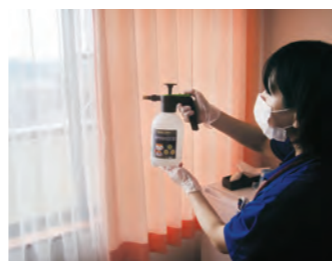
居室内のカーテンにも