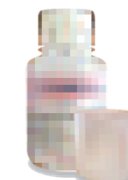
B液 ジアノーム pH調整剤