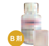
3 水道水を入れながらB剤を20ml入れる