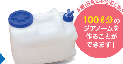
ジアノーム20L完成!! (塩素濃度50ppm±10ppm・pH6.0±1.0)