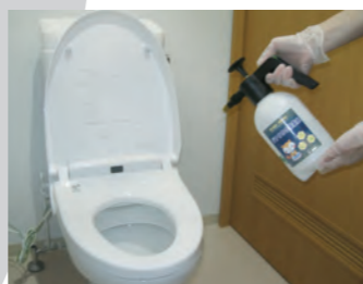
ご使用後のトイレにも