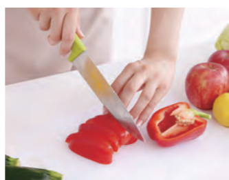
包丁やまな板にも