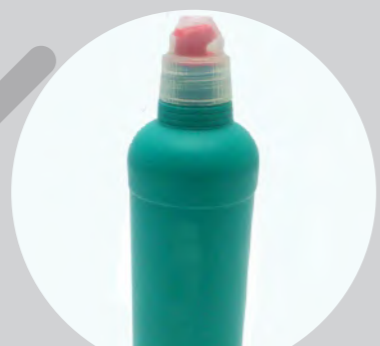
漂白剤を水で薄めて